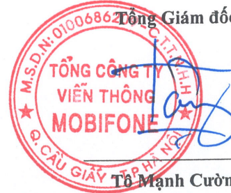
Tô Mạnh Cường