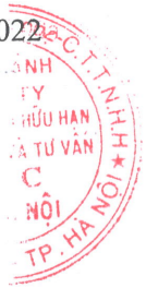
Tô Mạnh Cường