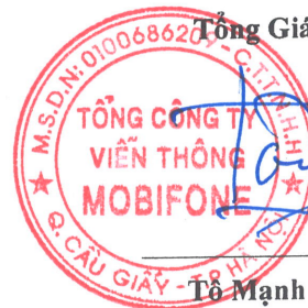
Tô Mạnh Cường